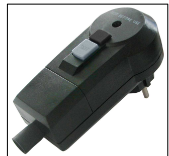
RCD-Stecker für Gerätesicherheit