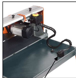
integrierte Pumpe zur Kühlwasserförderung