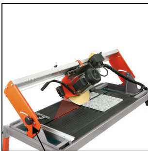
stufenlos schwenkbare Motorführung von 0°-45°