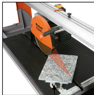
gradgenau einstellbarer Winkelanschlag für exakte Schnitte